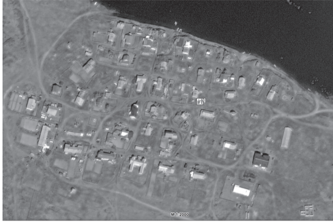
Схема размещения мест (площадок) накопления твердых коммунальных отходов ТКО на территории МО «Пешский сельсовет» (д. Белуше)