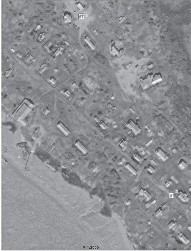
Схема размещения мест (площадок) накопления твердых коммунальных отходов ТКО на территории МО «Пешский сельсовет» (д. Волонга)